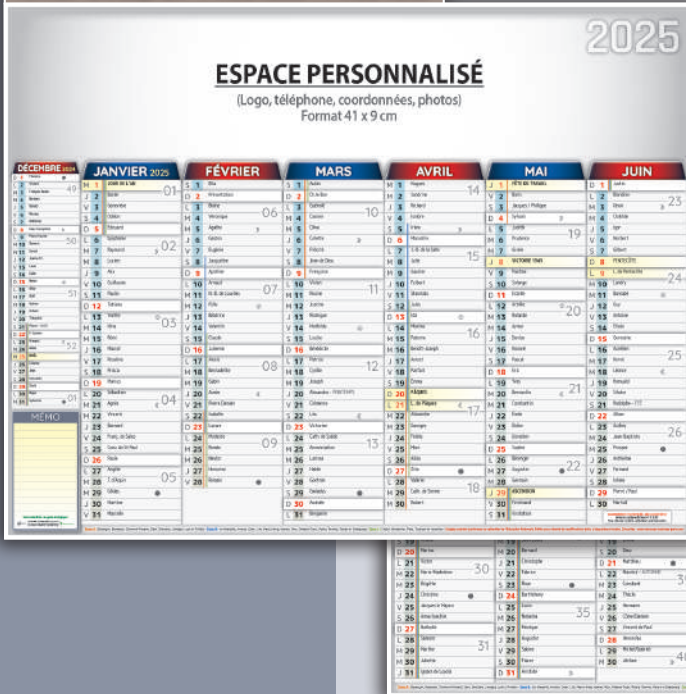
Format 43 x 33,5 cm - 7 mois Recto + 7 mois Verso