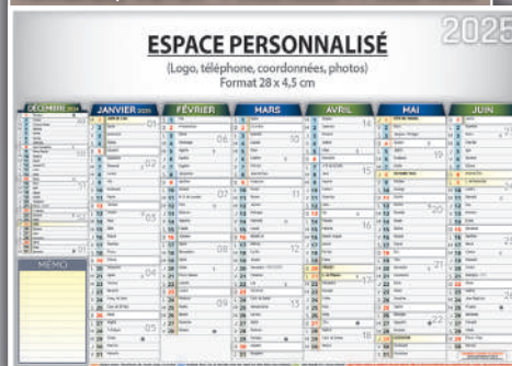
Format 29,7 x 21 cm - 7 mois Recto + 7 mois Verso

IMPORTANT : Commande impérative avant le 15 Octobre !